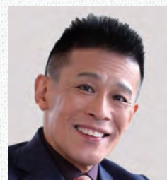
五代北条氏直役 俳優 柳沢 慎吾 〈小田原ふるさと大使〉